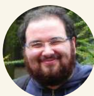
Mario Coiro Senckenberg Research Institute and Natural History Museum Alemania

Las conferencias serán un eje central del programa científico. A continuación, presentamos los/as conferencistas invitados/as ya confirmados/as