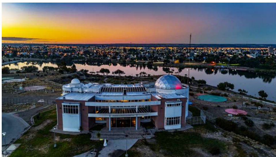
Centro Astronómico de la ciudad de Trelew y Reserva Natural Cacique Chiquichano

Ubicada en el centro de la región Patagónica, Trelew ofrece un entorno privilegiado para el estudio, la producción y la circulación del conocimiento científico y cultural. Se encuentra aproximadamente a 60 km de Puerto Madryn, 17 km de Rawson y 15 km de Gaiman, y cuenta con conectividad aérea diaria con Buenos Aires a través del Aeropuerto Internacional Almirante Marcos A. Zar (Trelew). Además, a pocos kilómetros, el Aeropuerto El Tehuelche (Puerto Madryn) ofrece también vuelos regulares. Trelew dispone de una terminal de ómnibus con conexiones regionales y nacionales, así como una variada oferta hotelera, gastronómica y de servicios que la posicionan como sede adecuada para encuentros académicos de escala nacional e internacional.