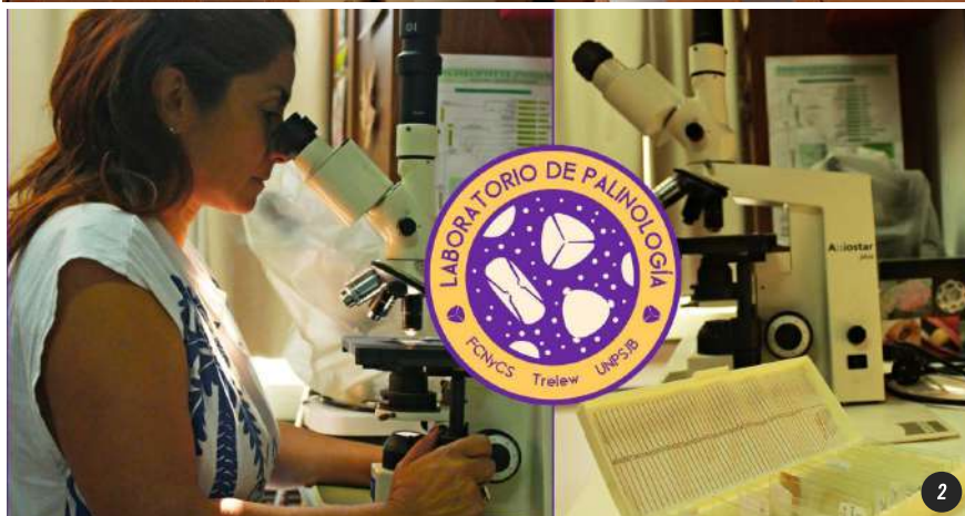
1. Laboratorio de Botánica, UNPSJB. 2. Laboratorio de Palinología, UNPSJB.